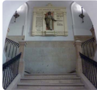
Escalera de Gala

En el frente de la escalera hay una placa con una imagen de la Victoria. La placa tiene dos inscripciones, una sobre la Constitución española de 1978 y otra donde se informa que Ávila fue declarada Ciudad Patrimonio de la Humanidad en 1985.