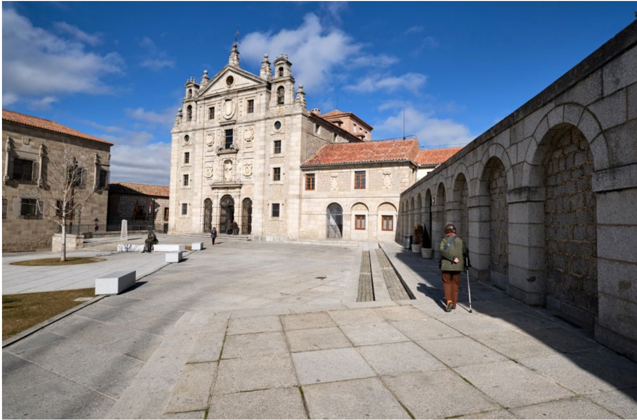
Mejora del acceso al monumento