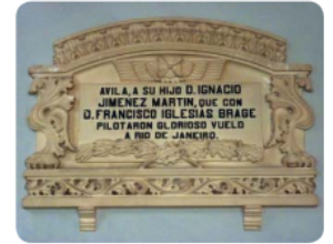
Placa en honor a los aviadores

Estos pilotos tienen el título de hijo predilecto y de hijo adoptivo de la ciudad de Ávila por la hazaña realizada.